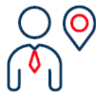
Firmy zarejestrowane w KRS

VERIF.PL współpracuje z Bisnode Polska Sp. z o. o. Baza danych firm pochodząca z Bisnode zawiera informacje o przedsiębiorstwach zarejestrowanych w Polsce.