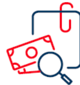
Raporty wywiadowni gospodarczej

Bisnode Polska Sp. z o.o. jest jedną z największych Wywiadowni Gospodarczych w Polsce. Baza danych Bisnode jest na bieżąco aktualizowana. Codzienna aktualizacja rekordów pozwala na dostępność danych on-line przez 24 godziny.