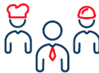
Jednoosobowe działalności gospodarcze